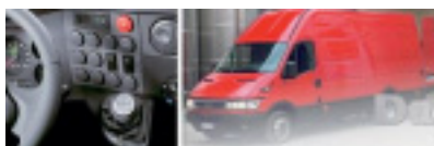
Schalten oder nicht – ganz nach Belieben.

Gesamtgewichten von 3,2 bis 6,5 t sind als Kastenwagen, Chassis/Kabine, Kipper, Kombis und Pritschenwagen mit Normal- oder Doppelkabine verfügbar, die Kastenwagen bis 3,5 t auf Wunsch sogar mit elektronischem Stabilitätsprogramm ESP.