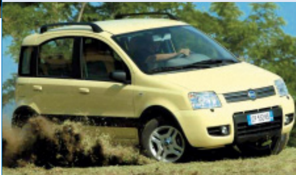
Wie geschaffen für alltägliche Abenteuer.

Der mit Abstand preisgünstigste Allradler mit fünf Türen auf dem Schweizer Markt heisst Fiat Panda und wird nicht nur in bergigen Gebieten hoch geschätzt. Nun gibt es den wendigen Kraxler neu auch mit dem 1,3 Liter grossen Turbodieselmotor und 70 PS. Maximales Drehmoment: 145 Newtonmeter – einfach bärig! Der solide Allradler ist sowohl in der Stadt als auch abseits geteuerter Pisten das ideale Fahrzeug. Dank seinem bei Bedarf automatisch über eine Viskokupplung zuschaltenden Vierradantrieb überwindet der Panda 4x4 Steigungen von bis zu 50 %, und dies sogar bei schlechten Haftbedingungen.