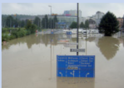
Einsatz rund um die Uhr.

Das Notruf-Team leistete unbürokratisch unzählige Überstunden, verschob sogar Ferien oder brach diese vorzeitig ab. Ein Riesenkompliment an alle, denn diese schwierige Zeit hat gezeigt, was ein Teamgeist meistern kann.