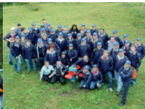
Gut gelaunt und perfekt ausgerüstet.