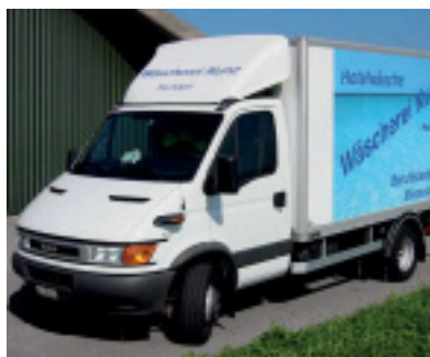
Der Iveco Daily 6.5t bringt nicht nur Wäsche. Er bringt auch handfeste Vorteile.

Wer die Fahrten bei höherer Nutzlast optimal ausnutzt, wird spätestens dann profitieren, wenn polizeiliche Gewichtskontrollen stattfinden.