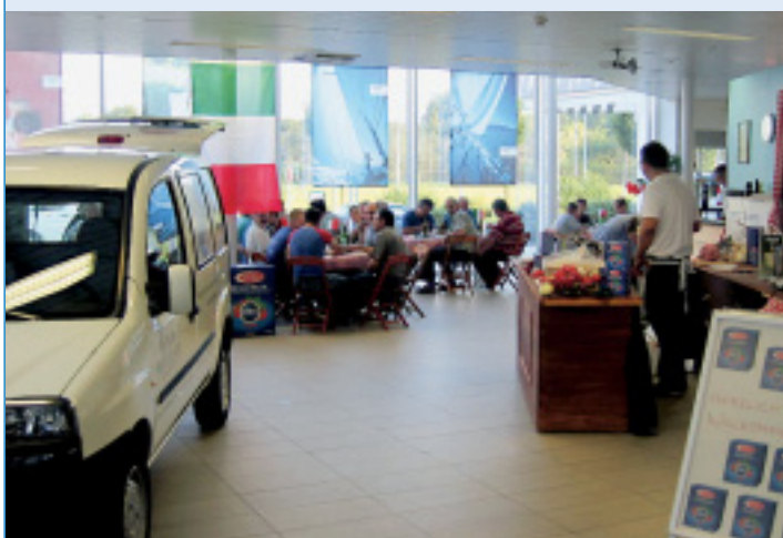
Inmitten italienischer Gastlichkeit präsentierte das Hammer Auto Center das Fiat-Nutzfahrzeug-Trio.

Technik, Aussehen und Ausstattung haben den Fiat Scudo aufgewertet. Der Fiat Doblò Cargo ist mit einem neuen Antrieb und dem 1.3 JTD Multijet-Motor mit 70 PS ausgestattet worden. Der neue Fiat Ducato ist mit dem leistungsoptimierten 2,8 JTD Turbodiesel (146 PS) und bärenstarkem Drehmoment (310 Nm bei 1500/min) bei reduziertem Verbrauch lieferbar. Angeboten werden die drei Modelle zu sagenhaften Konditionen.