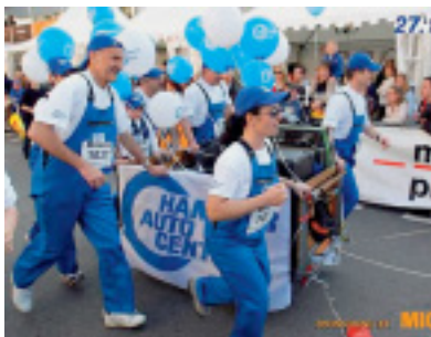
Dem Hammer-Team wird kräftig applaudiert!

Über zwanzig Mitarbeitende des Hammer Auto Centers – vom Lehrling bis zum Chef – beteiligten sich am 27. Luzerner Stadtlauf. Es war bereits ihr zweiter Einsatz. Zum sportlichen Sieg reichte es zwar nicht ganz. Mit ihrem originellen Einsatz aber gehörten das Hammer-Team eindeutig zu den Gewinnern. Zudem unterstrich die Teilnahme den guten Teamgeist.